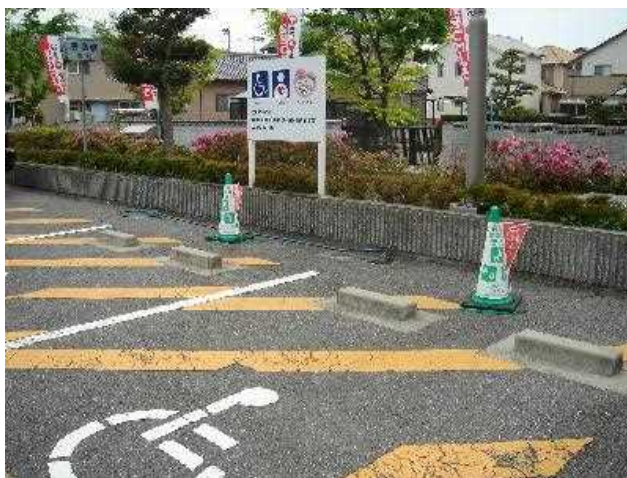
写真 愛媛県伊予郡松前町役場駐車場看板